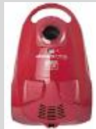
Rowenta / Moulinex

Langues / Languages : ES/PT/FR/NL/DE/IT/EL/EN