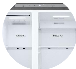
Affichage intérieur discret