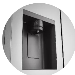
Distributeur d'eau épuré