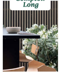
Montage Comptoir Bar long L 900 x P 345 mm