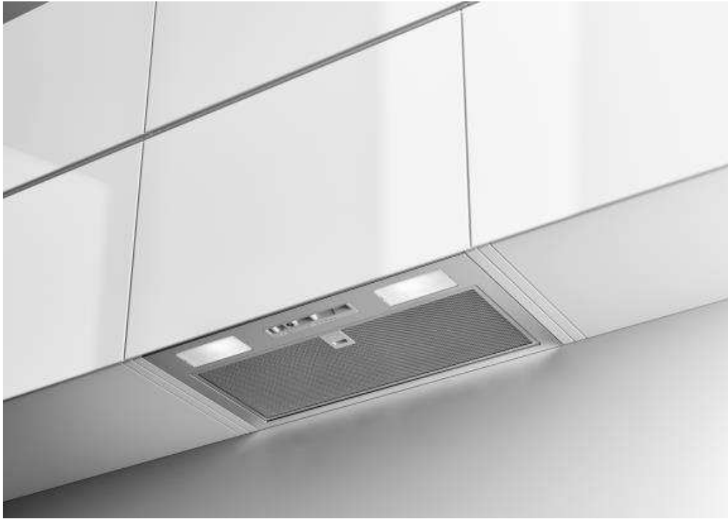
Façade / Cheminée : inox