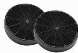
Filtres à charbon 0449613