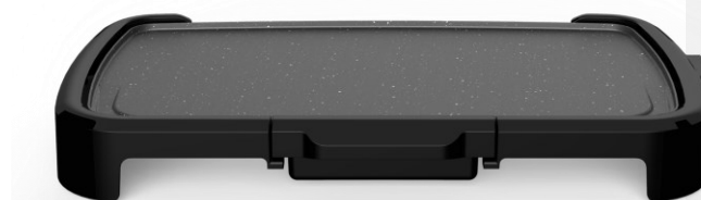
1330 cm 2