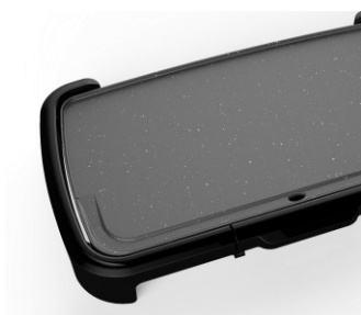
Sillons d'évacuation des jus et graisses